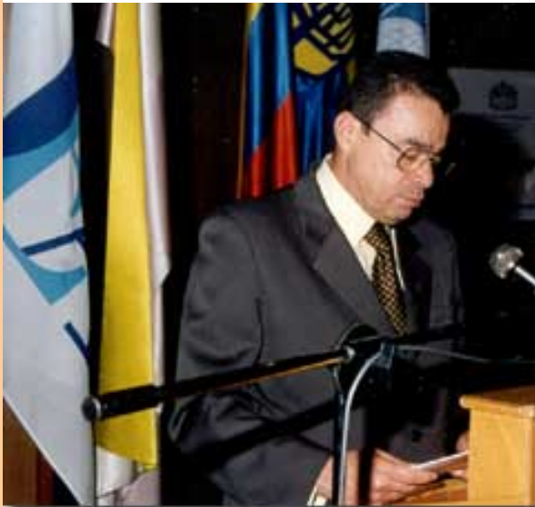
Ministro del Interior colombiano Sr. Armando Estrada Villa

La presentación del Manual tuvo lugar en Bogotá del 27 al 28 de Agosto, 2001. Se hizo en ocasión del Foro organizado por International IDEA junto con la Universidad Javeriana, la Universidad Sergio Arboleda y la Universidad de la Paz (UPEACE), bajo los auspicios de la Oficina del Alto Comisionado por la Paz, del Ministerio del Interior, de los periódicos colombianos El Tiempo y Semana y de la Agencia Internacional Sueca para el Desarrollo.